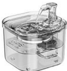
1 отсек для воды

Комплектация товара может меняться от поставки к поставке. Уточняйте текущую комплектацию у вашего менеджера перед оформлением заказа.