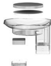
1 отсек для фильтра, 1 фильтр-элемент 2 хлопковых фильтра