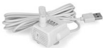
1 водяная помпа