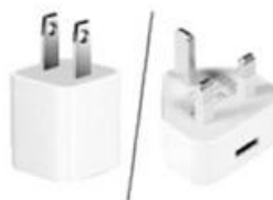
1 адаптер питания (опционально)